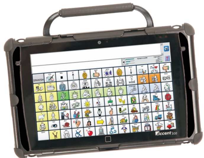
Accent® 800 with LAMP Words for Life.

O bien, pueden ser añadidos como un sistema lingüístico adicional por USD $395.