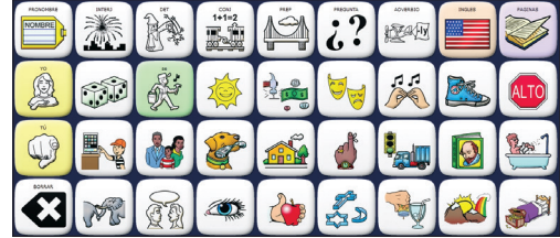
UNIDAD: español arriba e inglés abajo.